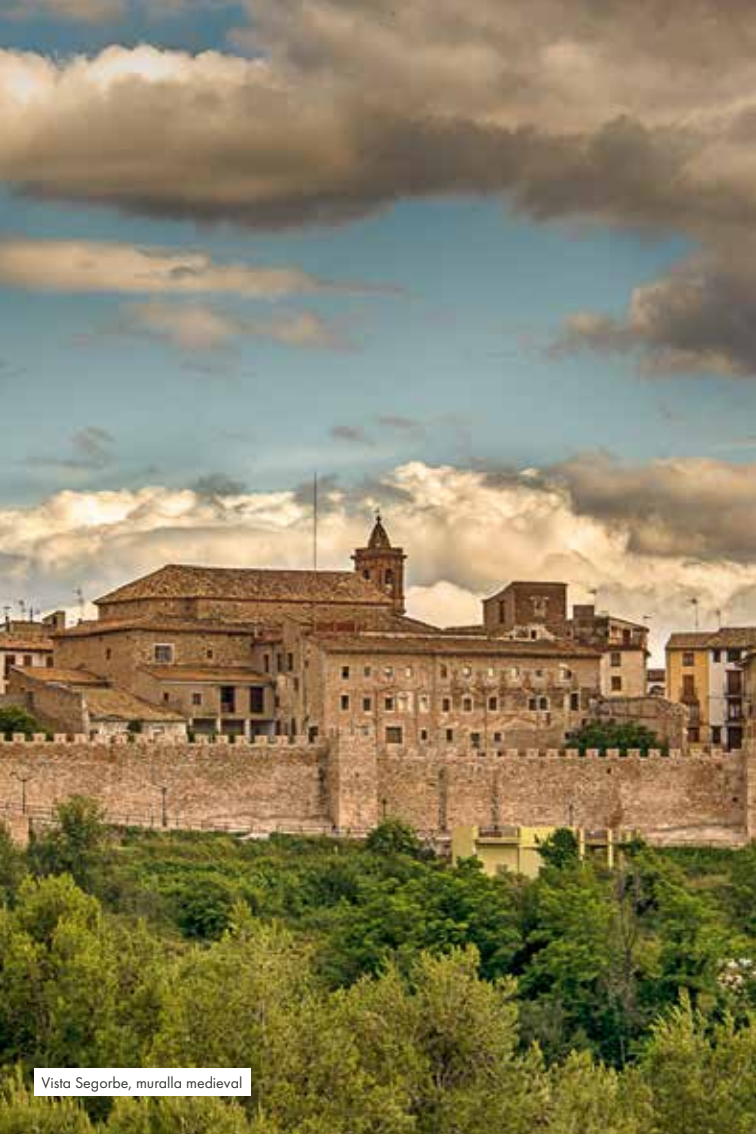
Vista Segorbe, muralla medieval