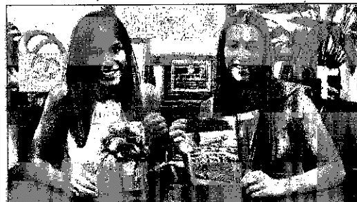
La edil de Fiestas y la reina, con las fotos seleccionadas. NÚRIA VERNET

► ACCIDENTE. El tráfico en la zona del marjal de Nules se vio afectado durante la tarde de ayer por un accidente de un vehículo. Un vecino de la zona, tras hacer maniobra en un entrador a una vivienda, se precipitó a una acequia. Aunque no se lamentaron daños personales ni materiales de consideración, los trabajos de extracción del coche bloquearon el paso de vehículos por el marjal. LCO/NULES