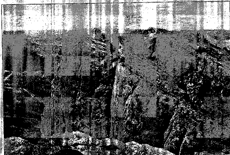
El entorno del Penyagolosa, una de las zonas con más impacto turístico en el interior.

De hecho, Bachero pone un ejemplo: «Un día un sanedrasta su-