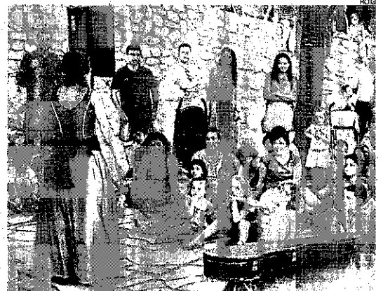
► Juegos de magia y efectos visuales sorprenden al joven público.